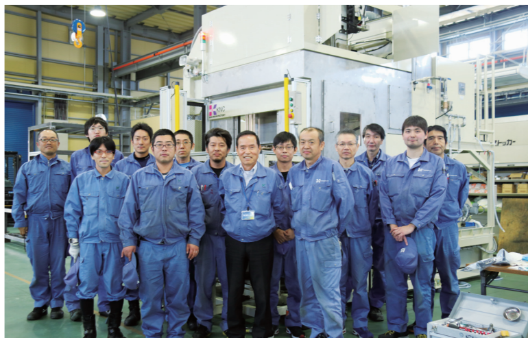
管社長(前列中央)と確かな技術力を誇るモノ作り集団

ほど存在します。後発の私どもが、同じことをやって参入する余地はありません。進出したとしてもコスト競争に巻き込まれてしまいます。