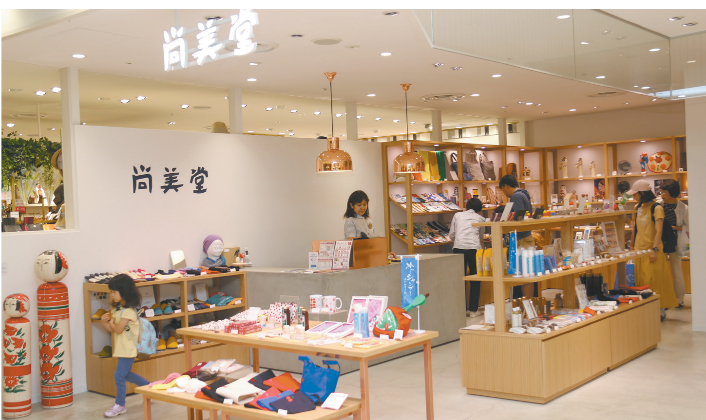
女性を主なターゲットにしたセレクトショップ「エスパル店」。新しいデザインの山形の贈り物を提供したいとブランディングに取り組む

七日町店 山形市七日町2丁目7番18号 ナナビーンズ1階北側 (☎023-622-3947) エスパル店 山形市香澄町1丁目1番1号 山形駅ビル エスパル2階 (☎023-628-1232)