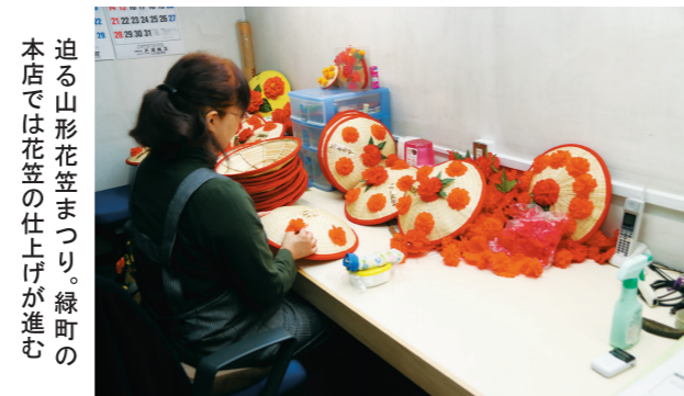
迫る山形花笠まつり。緑町の本店では花笠の仕上げが進む

山形花笠まつりを支えている花笠は、作り手の高齢化が進み、「このままでは十数年後には花笠まつりの開催が危ぶまれる」（逸見氏）という状況に。このため、山形市鈴川地