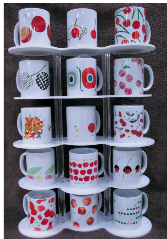
東北芸術工科大の学生がデザインしたサクランボのマグカップ