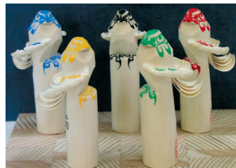
五輪のマークをアレンジしたフクロウ(上)とお鷹ぼっぼ(下)