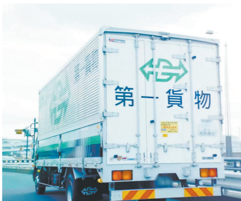
スピード感と信頼で全国を走行