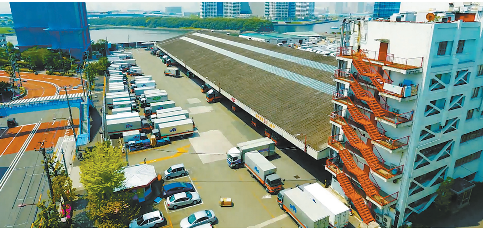
企業活動をリアルタイムで支える物流の拠点・東京支店ターミナル（東京都江東区東雲）

戦後の昭和26年に仙台と東京間の路線免許が認可されたのを機に東京支店を新築、これが足掛かりとなり、現在の長距離輸送・ネットワークが構築されていきます。当時の数少ない資料の中から東京にありました深川営業所の写真を見ますと、東京から東北に向う荷物が、荷台からあふれんばかりに積み込まれております。顧客の要望に応えられないほどの輸送ニーズで、戦後の復興を一枚の写真は物語っています。