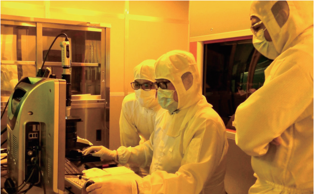
経産省の戦略的基盤技術高度化支援（サポイン）事業を受託し研究開発に取り組む