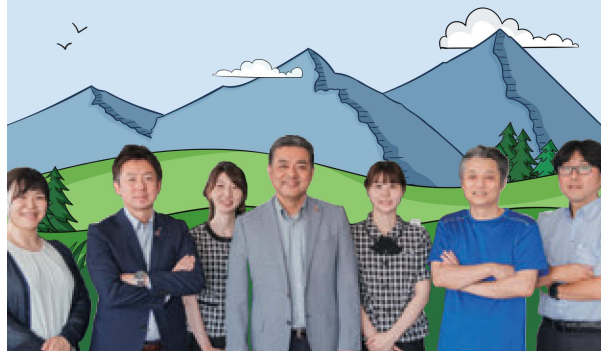
「CHALLENGE（チャレンジ）」を前面に掲げたパンフレット

す。また、オフィス移転や顧客とコラボした新商品開発のサポート。さらに当社の遊休スペースを活用し新たに取り組み事業も紹介しています。